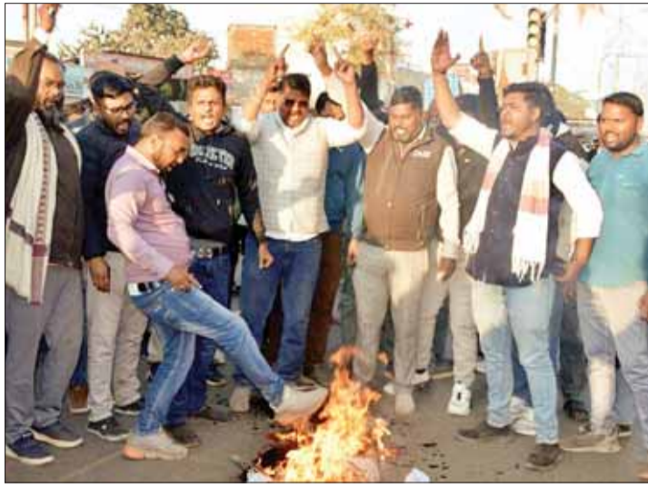
अस्थिर परिस्थितियां उत्पन्न न हों।