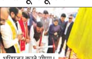
भूमिपूजन करते सीएम।

मुख्यमंत्री डॉ. मोहन यादव ने शनिवार को सतना में शासकीय मेडिकल कॉलेज में 383 करोड़ रूपए की लागत से निर्मित होने वाले 650 बिस्तरीय नवीन चिकित्सालय भवन का भूमिपूजन किया। चिकित्सालय भवन का निर्माण हो जाने से मेडिकल कॉलेज के समीप ही 650 बिस्तरीय के आधुनिक अस्पताल की सुविधा उपलब्ध हो जाएगी। मेडिकल कॉलेज के विद्यार्थियों को उपचार की प्रकृति के लिए अब दूर नहीं जाना पड़ेगा। सतना शहर में ही आधुनिक अस्पताल की सौगात मिलेगी।