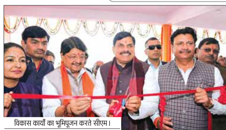
विकास कार्यों का भूमिपूजन करते सीएम।

मुख्यमंत्री ने 31 करोड़ रूपए की लागत से नवनिर्मित आईएसबीटी का लोकार्पण किया और इसका नामकरण 'अटल बिहारी वाजपेयी अंतरराज्यीय बस अड्डा' करने की घोषणा की। उन्होंने कहा कि अटल जी राजनीति में शुचिता और राष्ट्रीयता के प्रतीक हैं। उन्होंने राष्ट्र, धर्म और जनकल्याण के लक्ष्यों को लेकर सरकार चलाई। भारतीय संसद में 50 वर्षों तक अटल जी की निर्भीक वाणी गूंजती रही। मुख्यमंत्री ने कहा कि सतना में आईएसबीटी बन चुका है। राज्य सरकार की भी पूरी तैयारी है कि नए साल से प्रदेश में सरकारी बसों का संचालन प्रारंभ हो जाएगा।