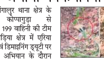
हुई, उसे सुरक्षा के सभी मानकों का पालन करते हुए केरिपु 199 वाहिनी की बीडीडी टीम की सहायता से मौके पर ही सुरक्षित रूप से निष्क्रिय कर दिया गया।

बीजापुर। गंगालूर थाना क्षेत्र के एफओबी कोप्पागुडा से सीआरपीएफ 199 वाहिनी की टीम एफओबी पीडिया क्षेत्र में परिया डॉमिनेशन एवं डिमाइनिंग ड्यूटी पर निकली थी। अभियान के दौरान पीडिया कैम्प से लगभग दो किलोमीटर की दूरी पर निर्माणाधीन सड़क से करीब 50 मीटर दूर डिमाइनिंग के दौरान माओवादियों द्वारा लगाए गए दो आईईडी बरामद